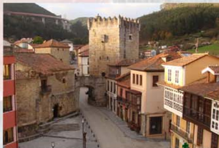
Vista de Salas. Elementos del Museo Prerrománico.

Llegado a Casazorrina se recomienda abandonar el Camino y seguir la carretera hasta Mallecín, para entrar en la Villa de Salas, donde podremos admirar numerosas muestras de arquitectura civil y religiosa y su casco histórico. Destacar la Colegiata de Santa María la Mayor, que alberga los restos del fundador de la Universidad de Oviedo e Inquisidor General, D. Fernando Valdés-Salas, en el mausoleo de alabastro obra de Pompeo Leoni; y la Torre Medieval, sede del Museo Prerrománico de Salas. A la torre se accede desde el Palacio de Valdés, en la Plaza de la Campa, donde se encuentra la Oficina de Turismo y un punto informativo permanente.